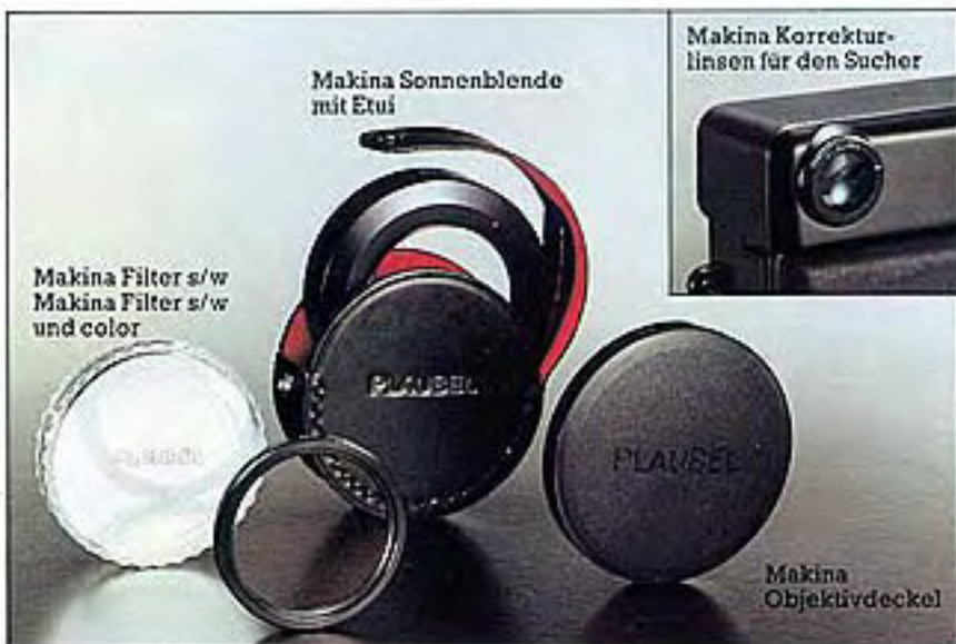
Makina Sonnenblende mit Etui

Ledertasche. Makina Tasche aus feinem Leder – aufklappbares Rückteil mit 3 Reißverschlußfächern, Kugelschreiberfach, 2 Scheckkartenfächern, 2 Schlaufen für Filme, Ledertrageriemen. In den Farben braun und schwarz. Die elegante Art, die makina 67 immer und überall griffbereit zu haben.